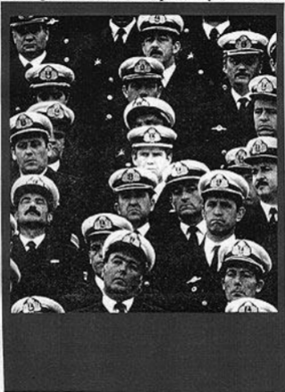
Alfredo Astiz y otros oficiales de la Fuerza Argentina de la Armada de los '70.