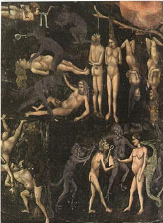
"Hercules Fureto" Goya, 1788, óleo, Caja de los Seguros, Toledo, España